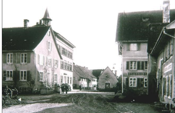
125 Jahre Ramser Dorfgeschehen