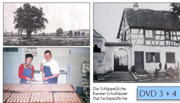
125 Jahre Ramser Dorfgeschehen

125 Jahre Bäckerei zur Krone Ramsen/Dorfgeschehen